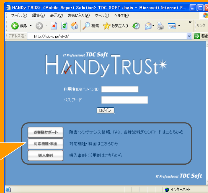
ハンディトラストのログインページ

新ホームページのリリースに伴い、ログインページのWhat's newは、新ホームページに移動しました！※詳しくは、「2. 新ホームページリリースに伴う製品サイトの改修」を参照ください。